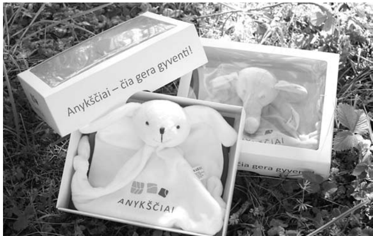
Nuo metų pradžios anykštėnų šeimoms jau išdalyti 39 tokie kūdikio kraiteliai.

Nuo šių metų vasario mėnesio Anykščių rajone gimę kūdikiai sulauks valdiškos dovanos - kūdikio kraitelio.