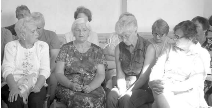
Raguvėlės gyventojai susitikime su rajono valdžia, matyt, vieni kitiems kalbėjo apie mažų mokyklų privalumus, nes priekaištauti rajono vadovams, regis, nėra dėl ko.